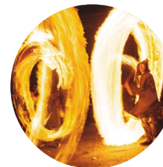
Festa del foc