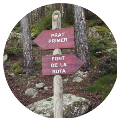
Indicadors durant el recorregut

Prat Primer: com a prat, s'entén extensió de terra on creix herba de pastura. El nom de Prat és de 269 i la seva etimologia: del llatí pratu , té el mateix significat.