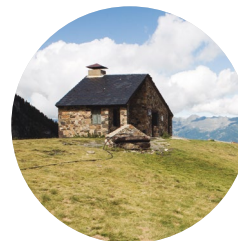
Refugi de Prat Primer