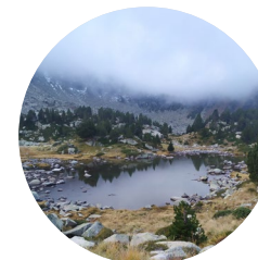
Estany de baix d'Ensagents

Aquest itinerari de gran bellesa transcorre per la vall d'Ensagents fins als estanys del mateix nom.