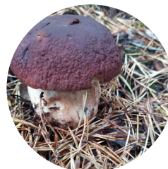
Cep ( Boletus pinophilus )