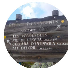
Panell de senyalització