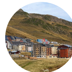
Pas de la Casa

Aquesta senzilla excursió ens portarà al Pic Blanc d'Envalira. Un pic que queda envoltat del Pic d'Envalira i del Pic Negre d'Envalira.