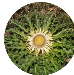
Carlina ( Carlina acanthifolia )