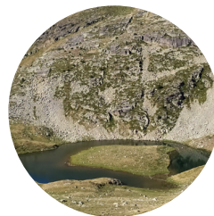
Estany de l'Islla

Etimologia: probablement del llatí rotare , "donar o fer voltes entorn d'un centre".