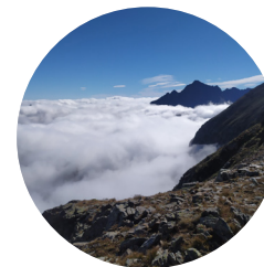
Carena del pic d'Anrodat