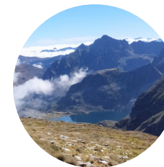
Estany de Fontargent

L'itinerari proposat comença a la Vall d'Incles, una de les valls més boniques del Principat que recorda paisatges alpins, amb petites cases de pedra ben integrades entremig de les pastures i sempre envoltades de muntanyes punxegudes.