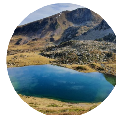
Estany de les Abelletes