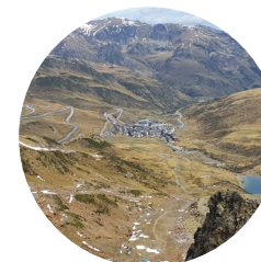
Vistes: Pas de la Casa