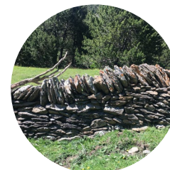
Paret de pedra seca