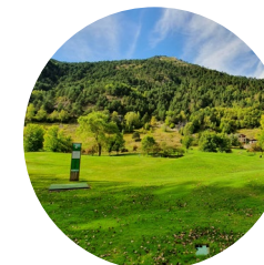
Camp de golf

Una de les incessants protagonistes al llarg i ample del nostre mediterrani país és la pedra seca, tant sigui en forma de senzill mur, marge o feixa, o bé una borda o qualsevol altra construcció amb més entitat. L'arquitectura en pedra seca és una tècnica de construcció basada a utilitzar de lligam res més que la força de gravetat de les pedres. I és una tècnica omnipresent en la configuració del paisatge agropecuari de les valls d'Andorra.