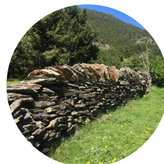
Mur de pedra seca