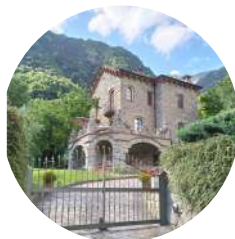
Casa dels Russos

Margineda: marge considerable, costa gran, situats a la vora del riu.