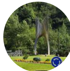
Rotonda de la Margineda

Aquesta senzilla i curta passejada et permetrà conèixer el petit poblet de Santa Coloma. L'itinerari s'inicia a la plaça del poble de Santa Coloma, davant de l'església romànica de Santa Coloma, que constitueix un dels exemplars més bells i interessants que hi ha a Andorra. La seva planta és molt simple i s'hi poden endevinar construccions pertanyents a èpoques diverses. És un edifici d'origen preromànic, de nau rectangular i coberta amb encavallades de fusta. L'edifici estava decorat amb pintures murals romàniques del s. XII realitzades pel Mestre de Santa Coloma. Aquestes pintures van sortir del país l'any 1930, anant a parar, finalment, al Museu Estatal Prussià de Cultura de Berlín. L'any 2007, i després de moltes negociacions, les pintures van ser recuperades pel govern andorrà.