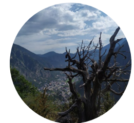
Paisatge del Roc de Persoma

Aquest itinerari s'inicia a la Margineda en direcció al poble de Santa Coloma, però abans d'arribar ja s'enfila agafant el camí de la Callissa. Al casc antic de la Margineda podrem gaudir d'un conjunt de bordes i cases pairals.