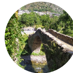
Pont de la Margineda