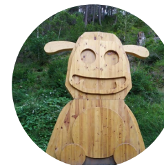
L'Andy, el tamarro d'Andorra la Vella