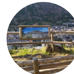
Mirador del Roc dels Senders

Aquest itinerari, que transcorre per la part més ombriva de la capital, és ideal per fer a l'estiu, donat que proporciona frescor gràcies a la protecció del bosc de l'obaga d'Andorra la Vella.