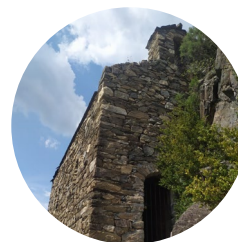
Església de Sant Martí de Nagol