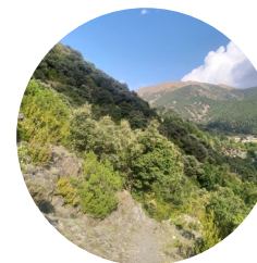
Camí de Sant Martí de Nagol

Aquest itinerari de dificultat moderada i de poc desnivell és un camí que surt de l'extrem nord de Sant Julià de Lòria i puja fent marrades fins al poble de Nagol, paral·lel al vessant esquerre del torrent. Hi ha algun tram, a l'inici del trajecte, on el camí està empedrat i té murs de protecció que el separen dels conreus. Al poble de Nagol, aquest camí enllaça amb un altre que va fins a la capella de Sant Martí de Nagol. Permet l'accés a diverses feixes que queden a un costat i l'altre.