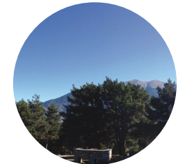
Coll de Rep

El camí de Fontaneda té inici al nucli urbà de Sant Julià de Lòria, al pont de Fontaneda. Els arbres que més hi abunden són les freixeres ( Fraxinus excelsior ), les alzines ( Quercus rotundifolia ) i els roures ( Quercus pubescens ). Els acompanyen alguns lledoners o delloners ( Celtis australis ) i noguers ( Junglans regia ).