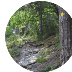
Tram del camí