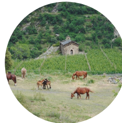
Sant Mateu del Pui d'Olivesa