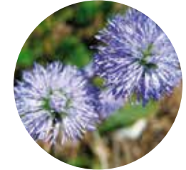
Anemone ( Anemone alpina )