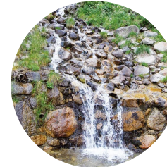
Salt del riu de Montuèll