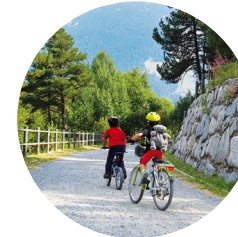
Excursionistes pel camí de les Pardines