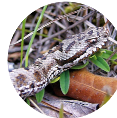
Eскурçó ( Vipera aspis )