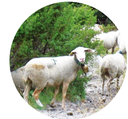
Ovelles al camí

El camí de Manyat té el seu inici al poblet de Certers, un petit nucli situat al peu de la serra de la Creu. Just a l'entrada del poble, el nostre camí abandona la carretera principal pel seu marge esquerre. La primera part del recorregut, des d'aquí fins als cortals de Manyat, correspon a un tram d'un sender de gran recorregut (GR).