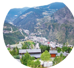
Sant Julià de Lòria