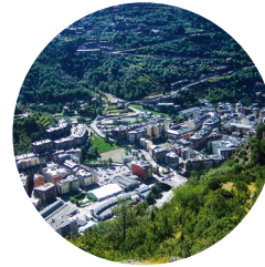
Sant Julià de Lòria

Rocafort: Roca prové d'un mot pre-romà rocca , mateix significat, del qual s'ignora l'origen exacte. Fort , del llatí forte , en el sentit de "resistent al pas, difícil de prendre, que es resisteix amb força a deixar-se prendre".