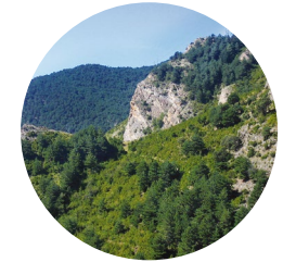
Camí de Rocafort

El camí de Rocafort es troba a la carretera de Fontaneda, a la parròquia de Sant Julià de Lòria. Des del capdamunt, la muntanya de Rocafort ens regala unes fantàstiques vistes de la parròquia a vol d'ocell.