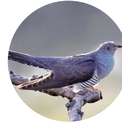
Cucut ( Cuculus canorus )