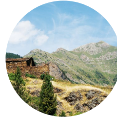
Alt de La Capa