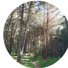
Bosc de Jou

Jou: Del llatí lugu , "que té perfí i arrodonit".