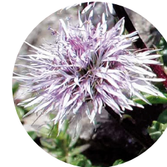
Lluqueta de roca ( Globularia cordifolia )