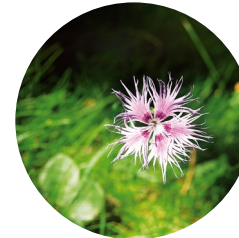
Clavell de pastor ( Dianthus hyssopifolius )