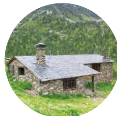
Refugi Borda de Sorteny