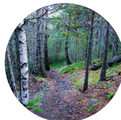
Beç ( Betula pendula )