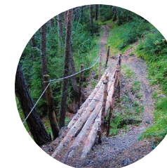
Pont al Camí

L'inici de la ruta transcorre per la vall de Prat Primer i està dominada per avellaners ( Corylus avellana ) i gerdoneres ( Rubus idaeus ). El camí s'enfila i el pi roig ( Pinus sylvestris ) comença a destacar per damunt de qualsevol altre tipus de planta llenyosa. Es distingeix pel seu tronc de color ataronjat. També hi creix el gatsaule o salanca ( Salix caprea ) i el beç o bedoll ( Betula pendula ). Uns metres més amunt hi ha la font de la Ruta, en un trencall a la dreta del camí. És una zona molt humida, de vegetació densa, amb trèmols ( Populus tremula ), que deuen el nom a la tremolor de les fulles quan fa vent, i alguns exemplars de moixera ( Sorbus torminalis ), moixera de guilla o besurt ( Sorbus aucuparia ) i avet ( Abies sp.). El trèmol és dels arbres que utilitza el picot negre per fer-hi el niu. En aquest sender, els excrements de guineu ( Vulpes vulpes ) ens indiquen la presència d'aquest bonic carnívor.