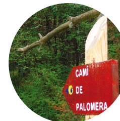
Encreuament de la Palomera