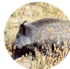
Senglar ( Sus scrofa )