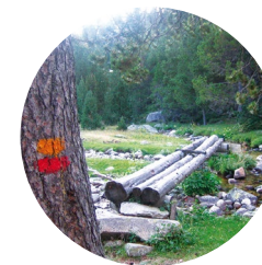
Passarel·la de l'Estall Serrer

L'itinerari de la Maiana és una de les excursions més fantàstiques de la Vall del Madriu-Perafita-Claror, ja que es passa per Entremesaigües, el refugi de Perafita i la collada de la Maiana, amb la possibilitat d'arribar a l'estany de la Nou. De baixada passem pel refugi de Fontverd i per Ràmio (conjunt de bordes típiques d'Andorra).