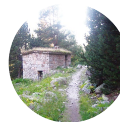
Cabana de la Farga