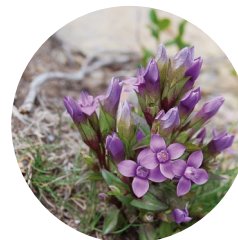
Genciana campestre ( Gentianella campestris )