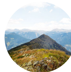
Pic de Carroi

Situada de ple al sud-oest del Principat a Sispony a la parròquia de La Massana, la serra d'Enclar esdevé una compacta unitat muntanyosa molt ben diferenciada dels massissos i serres de l'entorn. Està delimitada pels rius Muntaner, al nord, Valira del Nord, a l'est, i Valira, al sud-est.