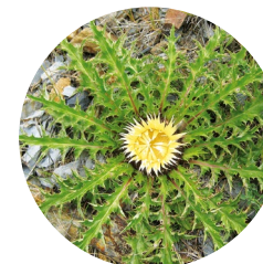
Carlina ( Carlina vulgaris )