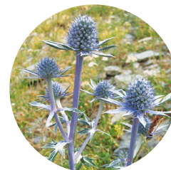
Card blau ( Eryngium bourgatii )