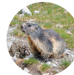
Marmota ( Marmota marmota )

Podem observar la impressionant cresta que uneix els dos cubils. Aquesta aresta és de gran dificultat i és preferible no accedir-hi sense material adequat.