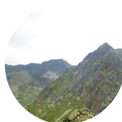
El Cubil Gran