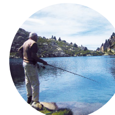
Pescador a l'estany Blau

Amb 2.1 hectàrees de superfície, l'estany blau, malgrat el seu nom, té l'aigua d'aparença tèrbola i una coloració una mica verdosa.