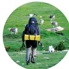
Excursionista a Perafita

Estany de la Nou: Del romànic noc , procedent del llatí naucu (derivat de navis ), no ho hem de relacionar amb el fruit del noguer, sinó amb la hidronímia. La filosofia d'aquest estany i el seu règim de proveïment d'aigua inclina a veure-hi una aportació d'aigua subterrània.