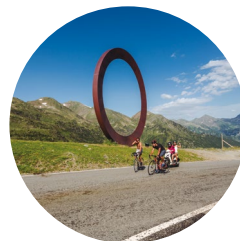
Escultura Arcalís 91