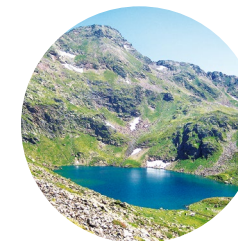
Pic de Tristaina i estany de Més Amunt

L'ascensió s'inicia a l'estació d'esquí d'Arcalís-Vallnord, després de passar pel curiós i gegantí monument circular que representa un anell d'acer de quatre metres de diàmetre, que situat a prop de la baixada vertiginosa cap a la vall, vol donar la sensació de provocar un desafiament entre les lleis de la casa i les lleis naturals. Aquest monument, anomenat Arcalís 91 , és obra de l'escultor Mauro Staccioli. Poc després d'aquesta obra mestra, arribem a la zona alta, a la Coma, on hi ha un bar-restaurant i una zona d'estacionament.