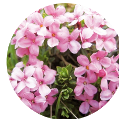
Andrósace Càmia ( Androsace carnea )