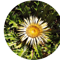
Carlina cinara ( Carlina acanthifolia )