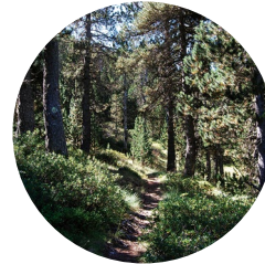
Bosc del Campeà