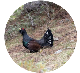
Gall de bosc

El Campeà és un bosc encampadà de grans dimensions. Al llarg del camí, passem per un autèntic jardí de flors: gencianes ( Gentiana ), pulsatil·les ( Pulsatilla ), soldanelles ( Calystegia soldanella ), prímules ( Primula ) o caltes ( Caltha palustris ) que es troben a prop de les fonts, entre moltes altres espècies.