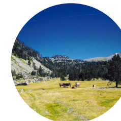
Pla de l'Inгла

La diversitat d'hàbitats que comprèn l'espai natural de la Vall del Madriu-Perafita-Claror contribueix a la presència d'una gran varietat d'espècies animals, que troben a la vall un entorn idoni per viure-hi. Els passos de muntanya que la connecten amb els països veïns afavoreixen també l'existència de corredors naturals que incrementen la biodiversitat de la zona.