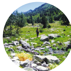
Pleta de Fontverd