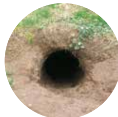
Cau de marmota