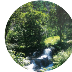
Riu de Claror i Perafita