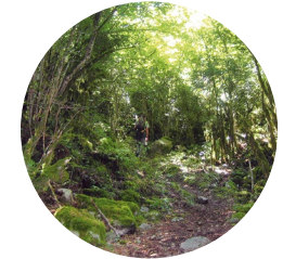
Camí de la Font del Boïgot

L'itinerari d'Entremesaigües està situat dins la Vall del Madriu-Perafita-Claror, a la parròquia d'Escaldes-Engordany. Aquesta parròquia s'estén pel sud-est del Principat d'Andorra. Limita, al nord, amb la d'Encamp i una mica amb la de la Massana i, a l'oest, amb la d'Andorra la Vella i la de Sant Julià de Lòria, amb les quals comparteix uns límits imprecisos.