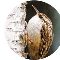
Raspinell ( Certhia brachydactyla )