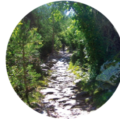
Camí de la Muntanya