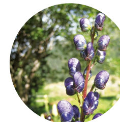
Tora blava ( Aconitum napellus )

El paisatge natural de tota la vall d'Ensagents alterna trams oberts amb d'altres de més íntims i tancats, amb zones humides i de gran interès florístic.