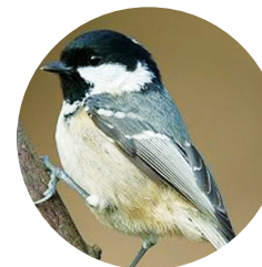
Mallerenga petita ( Parus ater )