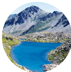
Estany del Cap dels Pessons