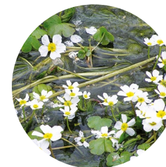
Ranuncle aquàtic ( Ranunculus aquatilis )

La vall que s'obre a la dreta pujant pel port d'Envalira en direcció a França, dins de la Parròquia d'Encamp, amaga un recorregut molt interessant per una successió d'estanys comunicats entre sí, alguns estanyols sense nom, rierols, espadats rocallosos, prats i àmplies panoràmiques, tot això enclavat al cor del circ glacial granític més gran del Principat d'Andorra. El GR7 i el GRP comparteixen traçat per aquest circ, i està coronat per cims de més de 2.700 metres, com és el cas de la collada dels Pessons, que en fa 2.810.