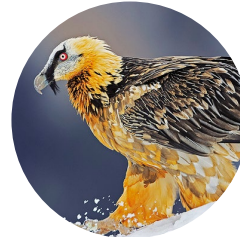
Trencalòs ( Gypaetus barbatus )