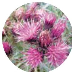
Card florit ( Carduus carlinoides )

Serrera: Del llatí serra , "cadena de muntanyes sense solució de continuïtat".