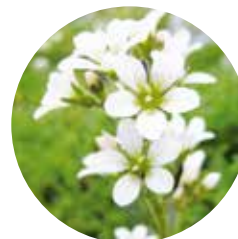
Enciam de font ( Saxifraga aquatica )