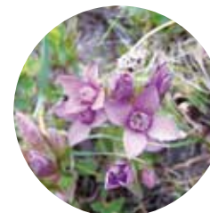
Genciana campestre ( Gentiana campestris )