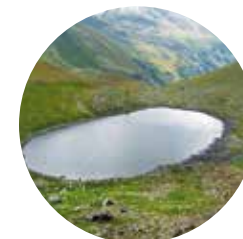
Estany dels Meners

El pic de la Serrera, amb els seus 2.912 metres d'altitud, és el cinquè cim que sobrepassa la cota de 2.900 metres, sobre un total de sis que hi ha a Andorra.