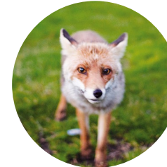
Guineu ( Vulpes vulpes )

Aquest sender avança per una zona boscosa de gran bellesa, ja que es tracta d'un bosc molt característic de les valls d'Andorra. L'arbre predominant a tota la pujada és el pi negre ( Pinus uncinata ), però també hi podem trobar un arbre de fulla caduca, el besurt, o moixera de guilla ( Sorbus aucuparia ). Aquest arbre, de port arbustiu molt elegant i espès, fa un fruit de color vermell que és una de les fonts d'alimentació de les guineus. És per aquesta raó que rep el nom de moixera de guilla, ja que guilla és un sinònim de guineu.