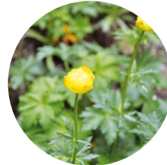
Herba de Sant Pere o rovell d'ou ( Trollius europaeus )