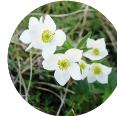
Jonquilla o Ranuncle pirinenc ( Ranunculus pyrenaicus )