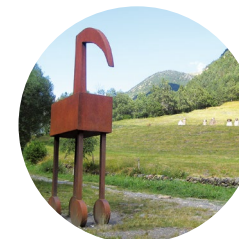
Escultura de la Ruta del Ferro

Jacint Verdaguer va ser, a més de capellà, un dels escriptors més importants en llengua catalana de la Renaixença. Nascut a Folgueroles l'any 1845, va ser fill d'una família modesta, però no inculta, i ràpidament va descobrir el seu interès per la tradició popular. Durant el seu internat al seminari de Vic, on va cursar la carrera eclesiàstica, es va familiaritzar amb la retòrica i els clàssics i es va involucrar en l'escriptura poètica. Entre els seus títols destaquen les poesies èpiques d'estil romàntic, l' Atlàntica i Canigó , i les col·leccions poètiques Idil·lis i cants místics , Pàtria , Montserrat , Flors de calvari i Aires del Montseny . En prosa va publicar Excursions i viatges , Dietari d'un pelegrí a Terra Santa , una col·lecció de rondalles i la sèrie d'articles publicats en premsa.