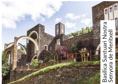
Basilica Santuari Nostra Senyora de Meritxell