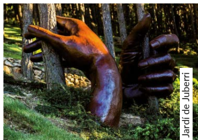
Jardí de Juberrí