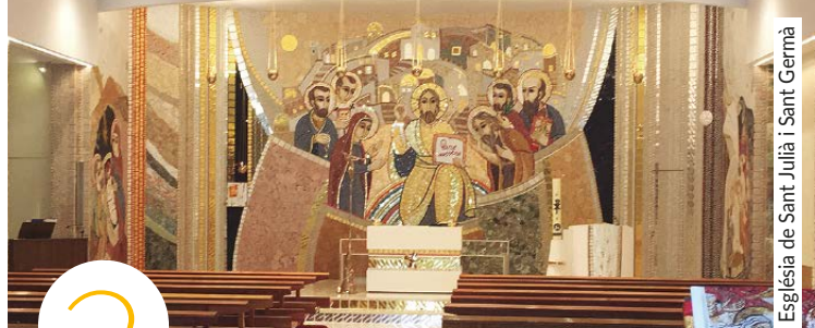
Església de Sant Julià i Sant Germà