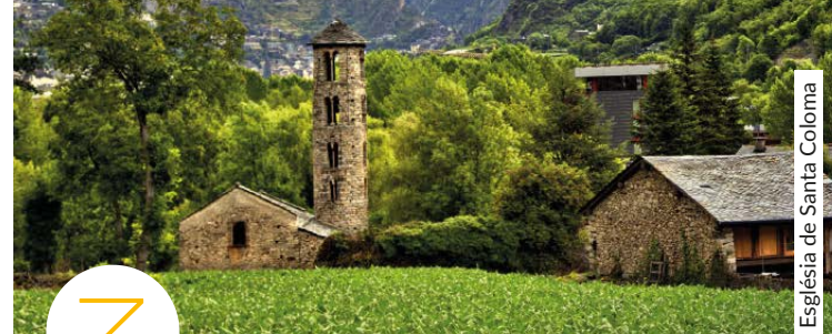
Església de Santa Coloma