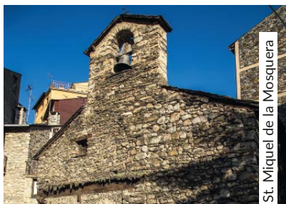
St. Miquel de la Mosquera