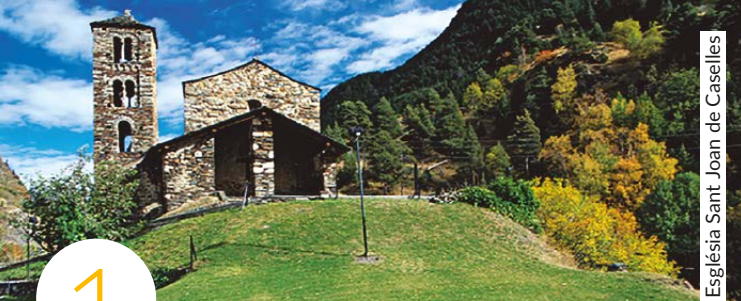
Església Sant Joan de Caselles