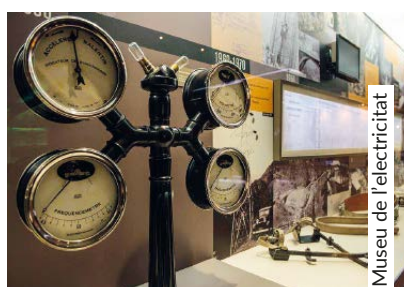
Museu de l'electricitat