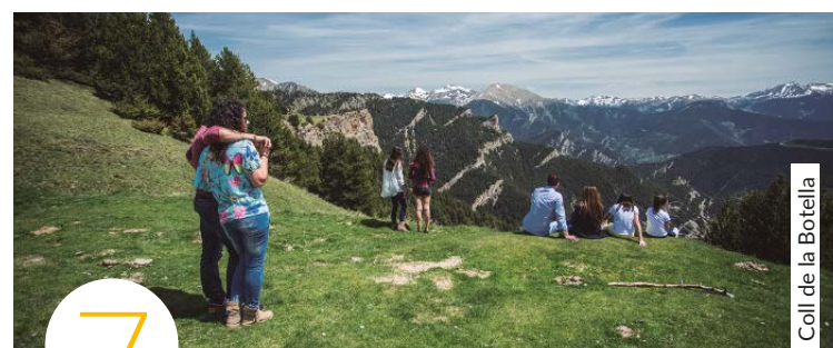
Coll de la Botella