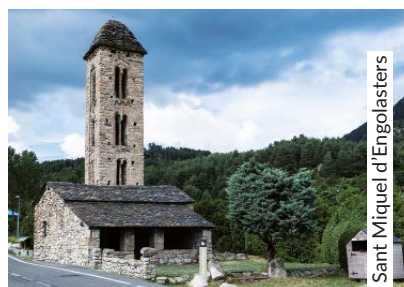
Sant Miquel d'Engolasters