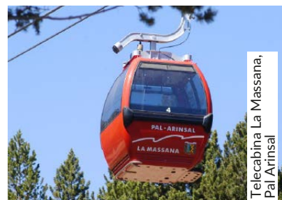
Telecabina La Massana, Pal Arinsal