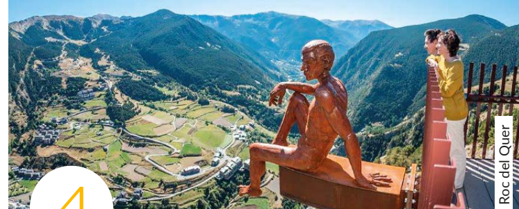
Roc del Quer