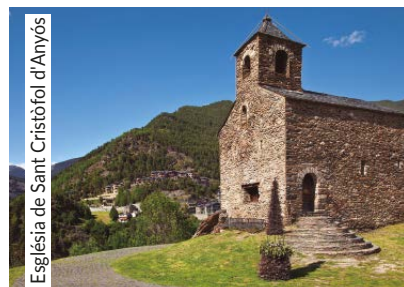
Església de Sant Cristòfol d'Anyós