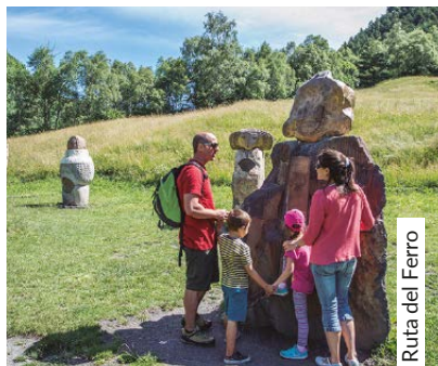
Ruta del Ferro

Dinar inclòs (excepte nens de 0 a 3 anys). Begudes no incloses Almuerzo incluido (excepto niños de 0-3 años). Bebidas no incluidas Repas compris (sauf les enfants 0-3 ans). Boissons non comprises Lunch included (except children 0-3 years). Drink not included