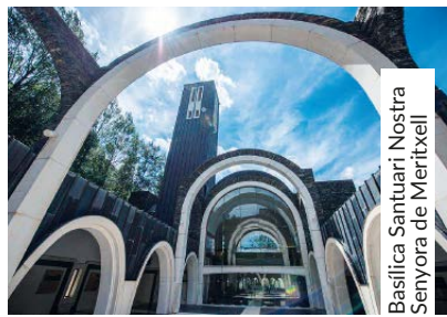
Basilica Santuari Nostra Senyora de Meritxell