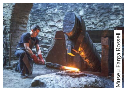
Museu Farga Rossell