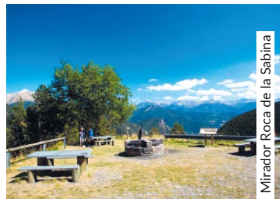
Mirador Roca de la Sabina