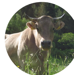
Vaca bruna andorrana