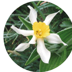
Narciso de los prados ( Narcissus Pseudonarcissus )

Laurèdia: según Joan Coromines, es el nombre antiguo de Lòria (Sant Julià de Lòria). Acorde con el Acta de consagración de la catedral de la Seu d'Urgell de 839, proviene del nombre propio latín Lauridius, aunque también se considera la opción Salòria , ya que parece contener la misma denominación y, en este caso, el uso del artículo indicaría un sustantivo apelativo al agua.