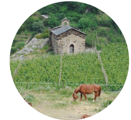
Sant Mateu de Pui d'Olivesa

Este fantástico itinerario circular por la parroquia de Sant Julià de Lòria nos permite descubrir los parajes más desconocidos del valle meridional. La alternancia de zonas abiertas con espectaculares vistas de la parroquia y zonas de bosques imponentes resulta muy interesante desde un punto de vista paisajístico.