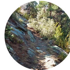
Camino del Roc de l'Àliga