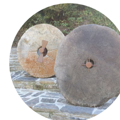
Ruedas de molino

La ruta de la iglesia de Santa Bàrbara hasta el refugio Borda de Sorteny es un itinerario lineal de unos 12 km que conecta los pueblos de Ordino y El Serrat para, finalmente, llevarnos al refugio guardado de Sorteny, situado en el Parque Natural del Valle de Sorteny. Es una excursión larga pero asequible, ya que no tiene mucho desnivel. Una buena opción para conocer a los pueblos de la parroquia de Ordino.