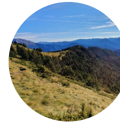
Coll de Turer

El Alt de la Capa es un pico con una altura de 2572 metros y se considera el mirador de Pal y de Arinsal. Esta cima con forma de pirámide no pasa desapercibida y no deja indiferente a ninguna persona, sea o no amante de la montaña.