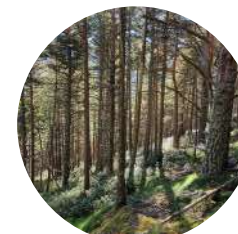
Bosc del Castell