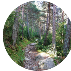
Camino del Cresper