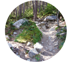
Camino del Cresper

En la parroquia de Encamp encontramos el lago de Engolasters, proveniente del río de Engolasters, afluente del Valira. La leyenda cuenta que ahí había un pueblo de descreídos que fue engullido por el agua. En aquel lugar, de noche, se reunían las brujas, que se bañaban desnudas en las aguas del lago. Los habitantes masculinos de Engolasters subían a espiarlas, pero si alguno de ellos era descubierto, las brujas lo transformaban en gato negro. Se cuenta que las brujas debían desaparecer a principios del siglo XX, coincidiendo con la instalación de las antenas de Ràdio Andorra y la construcción de una presa para la central de las Forces Hidroelèctriques d'Andorra (FHASA), inaugurada en 1934.