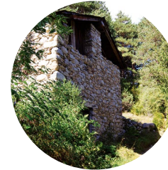
Borda del Cresper