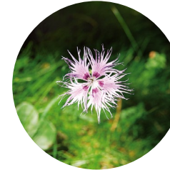
Clavelina deshilachada ( Dianthus hyssopifolius )