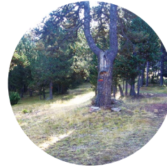
Llegando a Conangle

Juberrí: del latín iugus , "yugo", con la terminación erri , del vasco, "lugar o pueblo". De este núcleo urbano, aparecen diversas denominaciones y, quizás, agrupaciones separadas.