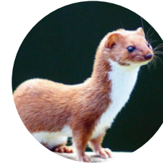
Comadreja ( Mustela nivalis )