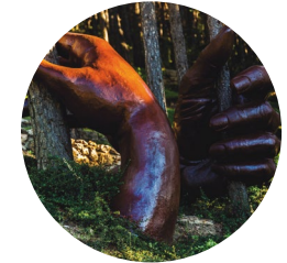
Jardines de Juberrí

El itinerario que aquí se presenta tiene salida en el pueblo de Juberrí y corresponde a un tramo del GRP, Gran Recorrido País, que da toda la vuelta a Andorra. El punto de salida se encuentra rodeado de álamos negros ( Populus nigra ) y fresnos ( Fraxinus excelsior ), que aprovechan la humedad de un pequeño torrente.