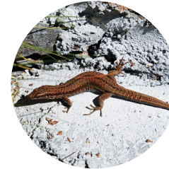
Lagartija roquera ( Podarcis muralis )