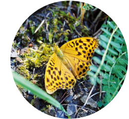
Nacarada ( Argynnis paphia )

Esta excursión sale desde el casco antiguo del pueblo de Arinsal. En invierno, es uno de los pies de pista para acceder a Vallnord (directamente del pueblo a la estación, a través de un telecabina) y cuando la nieve se derrite es el turno de los excursionistas que acceden al Parque Natural del Comapedrosa.