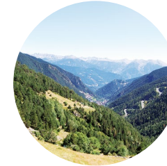
Valle de Arinsal