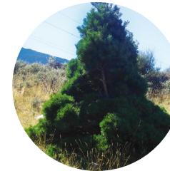
Nanismo en el Coll de Finestres