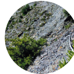
Tramo equipado con cuerda fija