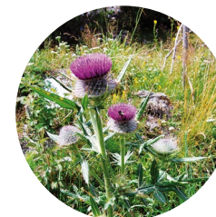
Cardo borriquero ( Cirsium eriophorum )