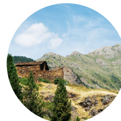
Alt de la Capa