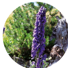
Acónito común ( Aconitum Napellus )

Pal: Del latín palu , “pal” – en castellano, “palo” –. Este pueblo está cerca de la frontera occidental. Tiempo atrás, con las grandes nevadas y las tormentas más importantes, uno podía desorientarse. Una alta y gruesa percha lo evitaba. El pal se encuentra en numerosa toponimia de los Pirineos.