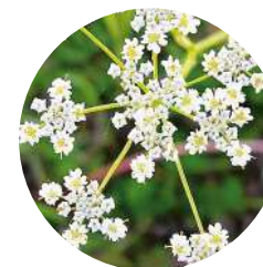
Alcaravea ( Carum carvi )