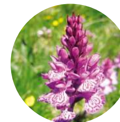
Orquídea moteada ( Dactylorhiza maculata )

En el 2010 se cumplieron 10 años de existencia del parque natural del Valle de Sorteny, y es sin duda un buen momento para conocerlo a través de esta agradable ruta de poco más de 4 kilómetros y un desnivel de unos 200 metros, resiguiendo en parte los senderos de interpretación del parque.