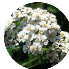
Milhojas ( Achillea millefolium )