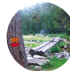
Pasarela del Estall Serrer

El itinerario de la Maiana es una de las excursiones más fantásticas del Valle del Madriu-Perafita-Claror, ya que se pasa por Entremesaigües, el refugio de Perafita y el collado de la Maiana, con la posibilidad de llegar al lago de la Nou. De bajada pasamos por el refugio de Fontverd y por Ràmio (conjunto de bordas típicas de Andorra).