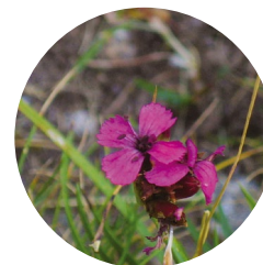
Clavellina ( Dianthus deltoides )