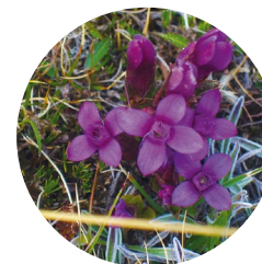
Genciana de campo ( Gentiana campestris )