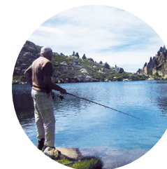
Pescador en el lago Blau

Con 2.1 hectáreas de superficie, el lago Blau, a pesar de su nombre, tiene las aguas de apariencia turbia y una coloración un poco verdosa.